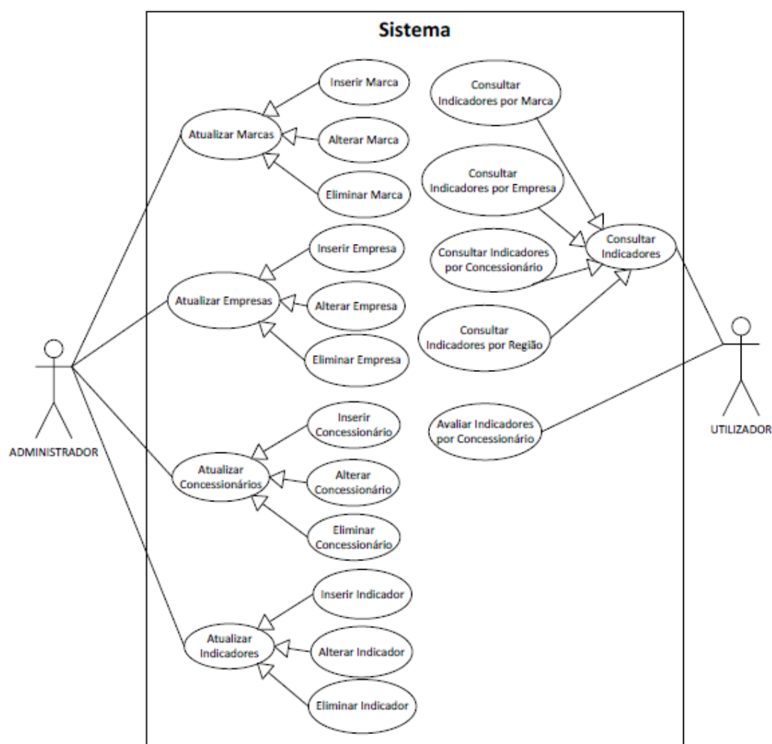
Figura 13 – Diagrama de Use Cases do Modelo de análise de desempenho de uma concessão automóvel