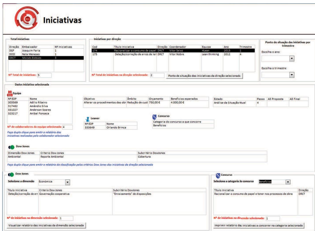
Figura 6 – Interface para consultar dados das iniciativas

Neste ecrã, foi também dado destaque à Gestão Visual, utilizando cores, logótipos e dispondo toda a informação relativa às iniciativas de uma forma organizada e estruturada numa única página.