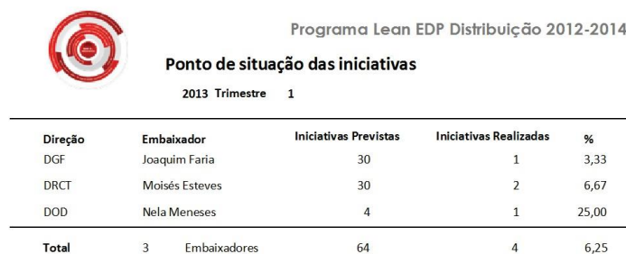
Figura 5 – Relatório do Ponto de Situação das Iniciativas

Neste ecrã, foi também dado destaque à Gestão Visual, utilizando cores, logótipos e dispondo toda a informação relativa às iniciativas de uma forma organizada e estruturada numa única página.