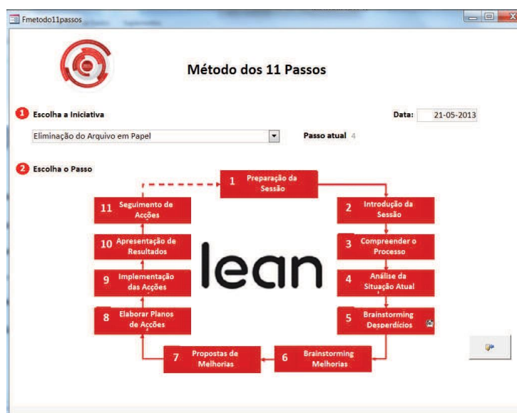
Figura 3 – Interface para alterar estado da iniciativa

A data de atualização da iniciativa será gravada automaticamente com a data em que esta é atualizada no sistema. Este é um exemplo de aplicação da ferramenta Heijunka , levando o coordenador a reportar o estado em que se encontra a sua iniciativa de uma forma nivelada, não deixando a apresentação do desenvolvimento da mesma para datas posteriores, dificultando o trabalho do Lean Office .